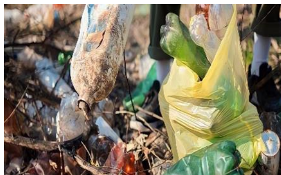
Gambar 4. Sampah non organik (CD.2)