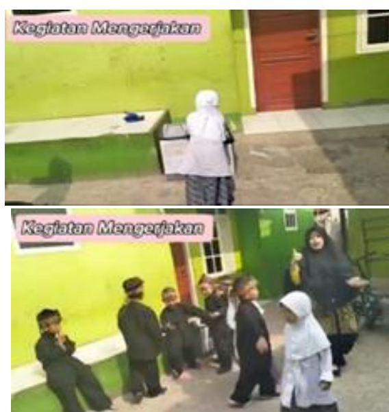
Gambar 7. Tahap mengerjakan (CD.5)