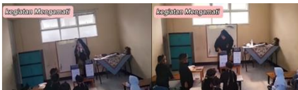
Gambar 5. Proses mengamati (CD.3)

Berdasarkan CD.2 anak-anak merupakan pelajar alami yaitu pelajar yang memiliki rasa ingin tahu yang tinggi, senang mengamati semua hal, dan senang bertanya terhadap hal yang menarik dan baru baginya (Najmah et al., 2023). Observasi dapat dimulai dengan menunjukkan contoh sampah organik dan non organik pada sekitar