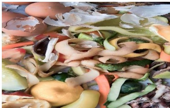
Gambar 3. Sampah organik (CD.1)