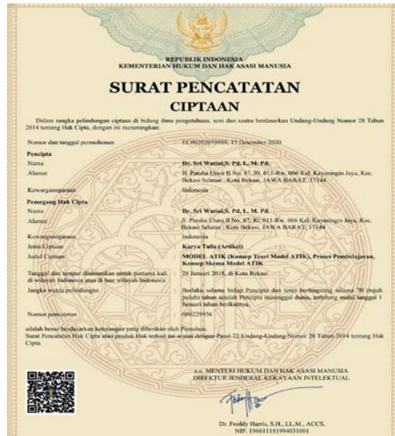
Gambar 1. HKI Model ATIK(Sri Watini, 2020)

Model pembelajaran ATIK merupakan Model pembelajaran yang dikembangkan dengan mengkolaborasikan model pembelajaran menggambar dari model Experiential Learning Theory (ELT) dengan Model pembelajaran tidak langsung yang lebih dikenal dengan model Inkuri (Udjir & Watini, 2022). Model pembelajaran ATIK pada Anak usia dini mempunyai ciri yaitu: rasa ingin tahu yang tinggi, suka melakukan identifikasi, mudah menerima segala informasi dari lingkungannya sekitarnya, suka bermain dan meniru. Model ATIK terdiri dari 3 komponen yaitu :