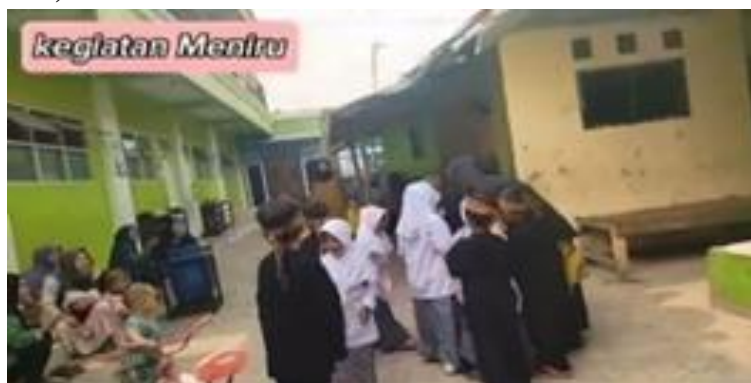
Gambar 6. Tahap Meniru (CD.4)

Berdasarkan CD.3 Mendorong anak untuk meniru perilaku yang benar terkait pengelolaan sampah, seperti membedakan sampah organik dan non organik di rumah atau di sekolah (Asnawiyah, 2020). Melibatkan mereka dalam kegiatan seperti penggunaan tempat sampah yang terpisah untuk organik dan non organik. Upaya menjaga kelestarian lingkungan harus bermula dari individu dengan melakukan hal-hal kecil. Perubahan yang dilakukan kemudian dapat memberikan dampak positif yang dimana menjadi kebiasaan dalam keluarga hingga ke masyarakat sehingga menjadi perubahan besar.