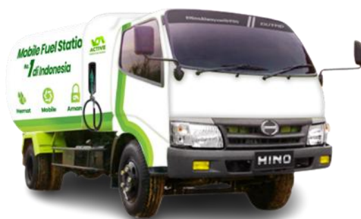
Gambar 2 Layanan BP Active MFS