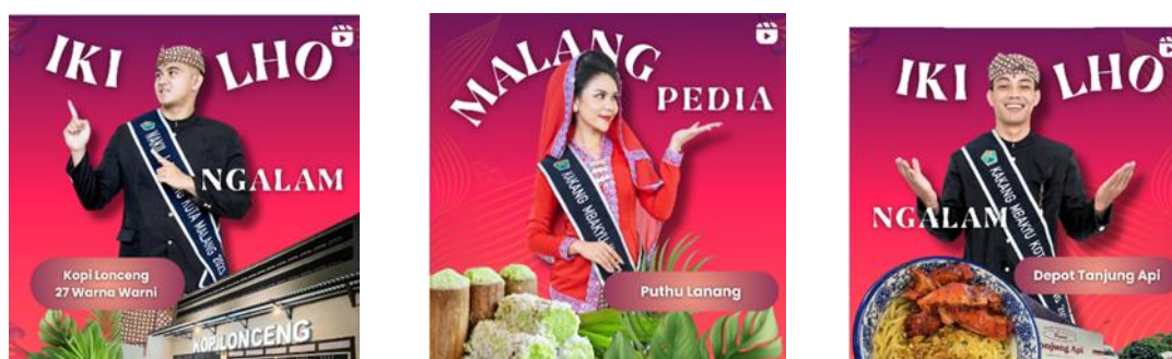
Gambar 2 Unggahan Virtual Tour Kakang Mbakyu Kota Malang

Tahapan selanjutnya adalah tahapan aksi dan komunikasi atau yang bisa disebut dengan implementasi. Menurut (Cutlip, Scott M., Center, A. H., Broom, 2006), tahapan ini terjadi implementasi, aksi, dan komunikasi yang sebelumnya sudah direncanakan sebelumnya sebagai upaya mencapai tujuan. Implementasi tahapan ini dalam konsep virtual tour Kakang Mbakyu Kota Malang, memuat Kakang Mbakyu aktif mulai melakukan produksi virtual tour mulai dari mengambil video sesuai dengan SOP yang diberikan oleh Kementerian Humas TI, melakukan editing video, membuat narasi, dan lain sebagainya. Selanjutnya tahapan ini juga dilanjutkan dengan diunggahnya Iki Lho Ngalam dan Malangpedia ke Instagram @kangyumalang.