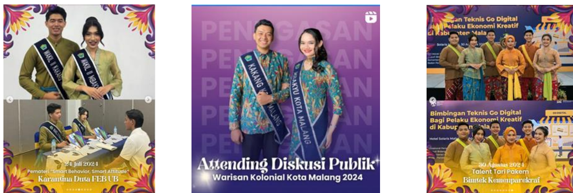
Gambar 1 Unggahan Penugasan Kakang Mbakyu Kota Malang

Berdasarkan hasil wawancara tersebut didapatkan fakta bahwa Kakang Mbakyu Kota Malang telah memahami dan melaksanakan ketiga fungsi atau tugas utama sebagai seorang duta wisata. Hal ini juga membuktikan adanya proses sosialisasi yang dilakukan dalam internal Paguyuban Kakang Mbakyu Kota Malang. Peran nyata yang dilakukan oleh Kakang Mbakyu Kota Malang juga dapat dilihat pada unggahan akun resmi Instagram @kangyumalang.