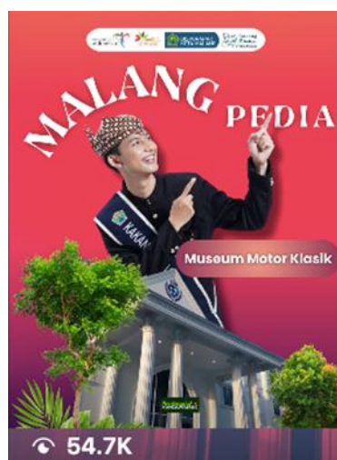
Gambar 4 Bukti Jumlah Views Salah Satu Konten Virtual Tour

Menurut hasil analisis peneliti, sebagai salah satu bentuk Digital Public Relations, Kakang Mbakyu Kota Malang telah menyesuaikan tahapan evaluasi yang dilakukan yaitu dengan melihat bagaimana proses respon yang terjadi di media digital yaitu dengan melakukan pengecekan berkala pada Direct Message, jumlah likes, comment yang diberikan oleh masyarakat, hingga jumlah share. Hal ini tentunya berkaitan dengan bagaimana informasi yang ingin diberikan dapat diterima dengan baik oleh masyarakat, yang juga akan berhubungan dengan citra Kakang Mbakyu maupun Kota Malang itu sendiri.