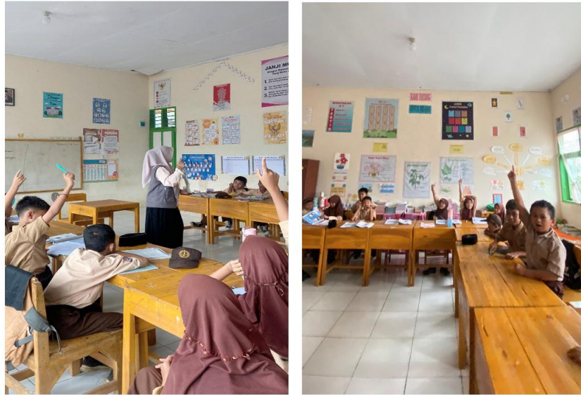
Gambar 4. Antusiasme siswa pada pembelajaran Fonetik Alfabet

Respon positif siswa terhadap pembelajaran fonetik alfabet internasional dapat dilihat dari beberapa pertemuan yang menunjukkan bahwa siswa antusias dan tertarik untuk belajar. Minat dan keinginan yang tinggi dari siswa. Simbol-simbol baru dalam IPA sangat disukai karena berbeda dengan alfabet biasa. Rasa penasaran mereka mendorong mereka untuk mempelajari lebih lanjut tentang cara mengucapkan simbol-simbol tersebut. Siswa berpartisipasi secara aktif dalam proses pembelajaran. Mereka ingin mencoba meniru apa yang di ajarkan, bahkan meminta untuk diulang beberapa kali hingga mereka bisa mengucapkan dengan benar.