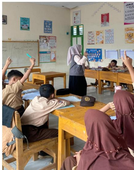
Gambar 1. Pengenalan Dasar Fonetik Alfabet

Pada setiap pertemuan pembelajaran Fonetik Alfabet menggunakan IPA, siswa sering mengalami beberapa kesalahan dan kekurangan. Mereka sering bingung dengan simbol Fonetik yang tidak umum salah satunya, /θ/ - bunyi ini muncul pada kata “ think ” dan “ both ” menghasilkan bunyi seperti “th” tak bersuara. Kesulitan membedakan bunyi vokal panjang dan pendek seperti /u:/ - bunyi “oo” dalam kata food /fu:d/ dan /ʊ/ - bunyi “i” dalam kata sit /sɪt/. Kesalahan pelafalan yang paling umum adalah penggabungan bunyi, siswa kurang fokus saat praktik pronunciation , dan juga beberapa siswa mengalami kesulitan dalam memahami dan mengingat simbol fonetik.