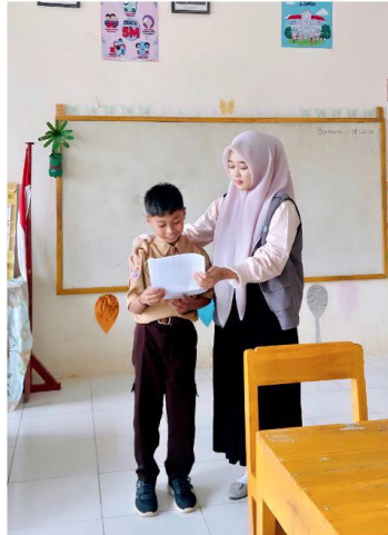
Gambar 3. Praktik Pronunciation Fonetik Alfabet

Praktik fonetik alfabet membantu siswa SD kelas 4 untuk memahami dan menguasai pelafalan kata dalam bahasa asing, yang mengarah pada peningkatan akurasi dan kepercayaan diri. Siswa juga lebih mudah menemukan kesalahan pelafalan dan memperbaikinya lebih cepat. Pemahaman siswa tentang struktur bunyi menjadi lebih baik. Hal ini menunjukkan bahwa siswa lebih cepat belajar mengeja dan mengenali kata-kata baru karena mereka mulai memahami bunyi yang disusun dalam sebuah kata. Penggunaan Fonetik Alfabet Internasional di kelas, terutama di SD kelas 4 selama 6 kali pertemuan melibatkan banyak proses dan tantangan yang perlu di perhatikan. Peneliti menyiapkan materi yang meliputi fonetik, simbol IPA dan kegiatan menarik yang mendukung proses pembelajaran. Peneliti juga menyiapkan alat bantu untuk mendukung pembelajaran, contohnya poster Alfabet. Penyampaian materi dengan sederhana kepada siswa untuk menekankan pentingnya pelafalan yang benar melalui International Phonetics Alphabet . Siswa diberi contoh yang relevan dan familiar, seperti kata-kata Bahasa Inggris yang sering mereka dengar, contohnya: Cat – /kæt/, Dog – /dɒg/.