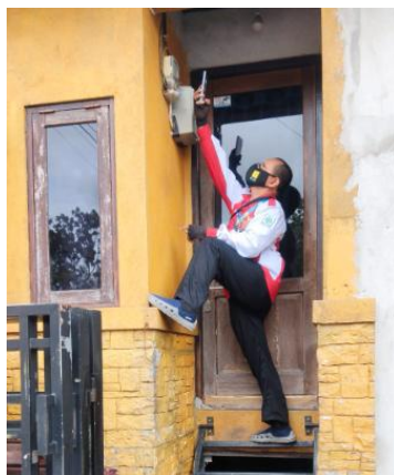
Gambar 2. Biller memfoto kwh meter (PT PLN (Persero), 2023)

Berdasarkan jadwal kegiatan yang telah ditentukan, kegiatan pendataan LPB ditargetkan dapat diselesaikan dalam waktu 7 hari kalender dalam 1 bulan pekerjaan dengan total 68 biller dengan total work order bulanan sebanyak 61.166 pelanggan. Berdasarkan jadwal yang ada tersebut tiap biller mampu menyelesaikan pendataan rata-rata 129 pelanggan per hari. Faktanya berdasarkan Gambar 2 pada bulan Maret April alokasi jumlah hari tersebut berkurang menjadi 5 hari saja dikarenakan adanya penambahan kegiatan baru yang dimasukkan ke jadwal kegiatan. Tentunya dengan berkurangnya hari pekerjaan berpengaruh langsung terhadap pencapaian bulanan.