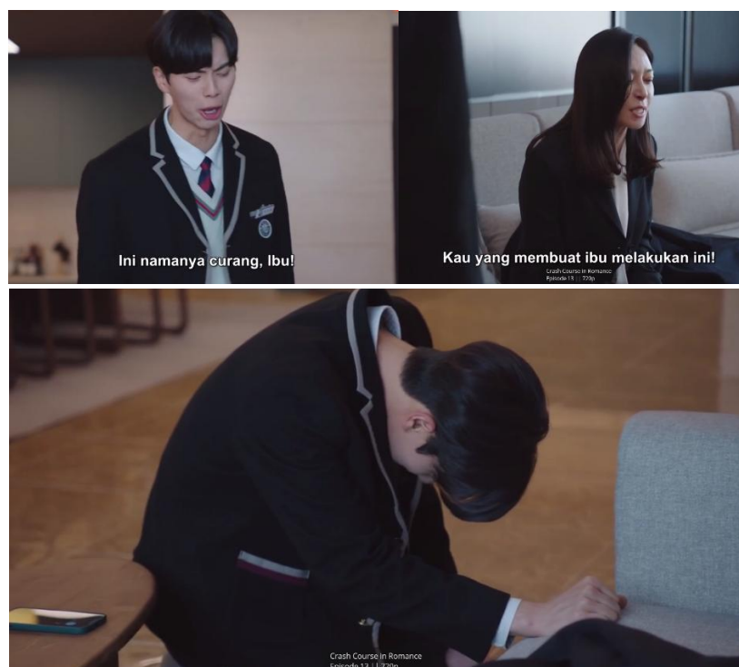
Gambar 1. Visualisasi Episode 13 dari Data Olahan Peneliti, 2024

Pola asuh permisif yang diterapkan oleh ibu Sunjae tercermin jelas dalam episode 13, ketika ia berselisih dengan Sunjae karena ibunya telah memberikan soal ujian bocoran kepadanya. Dalam adegan ini, ibu Sunjae tidak hanya menunjukkan ketidaktertarikan terhadap nilai-nilai moral, tetapi juga menunjukkan tekanan besar yang ada dalam sistem pendidikan Korea yang sangat kompetitif. “ Kau yang membuat ibu melakukan ini ” adalah kalimat yang diucapkan ibu Sunjae saat diminta klarifikasi oleh Sunjae terkait soal ujian tersebut, yang memperlihatkan bahwa ia menganggap tindakan curang tersebut sebagai jalan yang sah demi keberhasilan akademik anaknya.