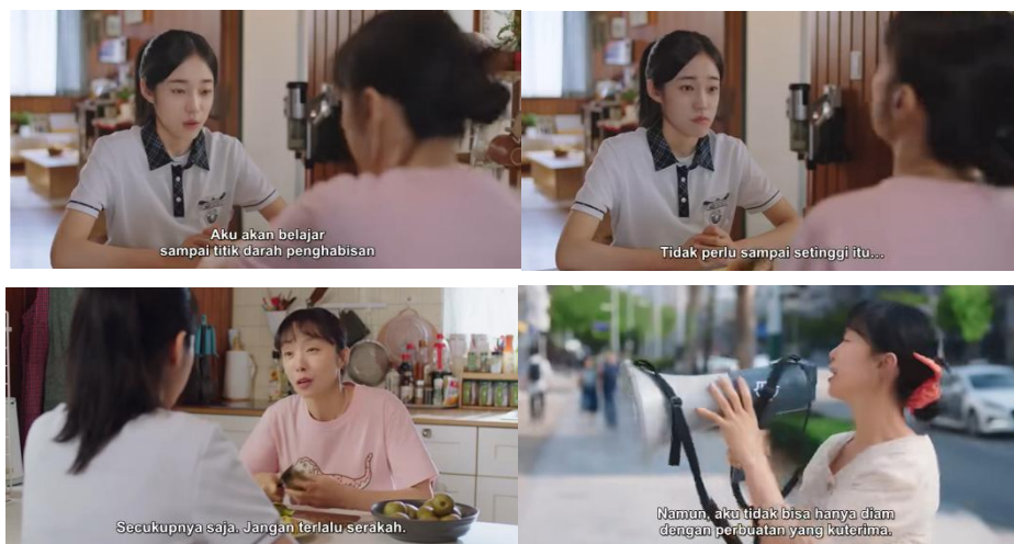
Gambar 2. Visualisasi Episode 4 dari Data Olahan Peneliti, 2024

Pendekatan Nam Haeng Seon ini memberikan kontras yang tajam dengan pola asuh ibu Sunjae, yang digambarkan sering kali memaksakan ambisi pribadi pada anaknya. Alih-alih memberikan dukungan emosional, ia lebih banyak memprioritaskan hasil akademik, yang pada akhirnya menciptakan tekanan yang berlebihan dan konflik dalam hubungan mereka.