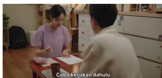
Gambar 3. Visualisasi Episode 5 dari Data Olahan Peneliti, 2024