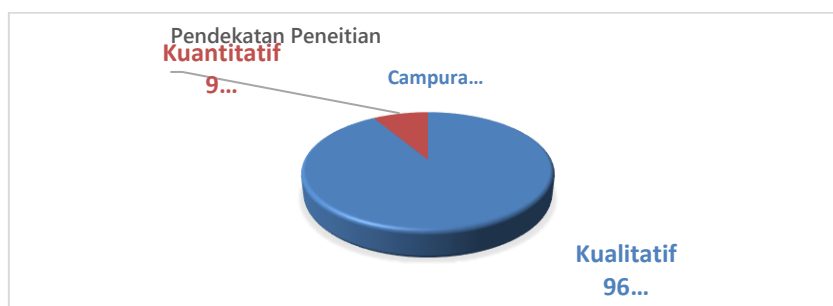
Gambar 1. Pendekatan penelitian Dosen Prodi KPI UIN Saizu Purwokerto

Selanjutnya, dari 70 penelitian lapangan, penulis mengelompokkan penelitian ini berdasarkan metode penelitian yang dipilih. Metode penelitian yang digunakan oleh dosen Prodi KPI UIN Saizu Purwokerto sebagian besar adalah metode kualitatif. Metode kualitatif berjumlah 96 penelitian, sedangkan penelitian kuantitatif berjumlah 9 orang. Sedangkan metode gabungan Kualitatif-kuantitatif tidak ada. Berikut adalah Gambaran perbandingan penggunaan metode penelitian yang dipilih oleh dosen Prodi KPI: