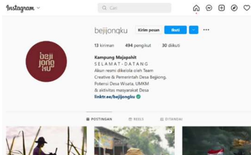
Gambar 3. Akun Instagram @bejjongku

Dari penggambaran tentang digitalisasi produk lokal Desa Bejjong di atas, nampak adanya hubungan patron klien yang terjadi antara Pemerintah Desa Bejjong dengan IKM produk lokal yang ada di Desa Bejjong. Pemerintah Desa Bejjong menduduki posisi patron dengan modal kekuasaan dan akses untuk menawarkan produk lokal melalui digitalisasi. Sedangkan IKM Desa Bejjong menjadi klien yang harus patuh pada patron untuk digitalisasikan produknya. Hubungan ini bersifat simbiosis mutualisme, patron mendapatkan kepercayaan dari klien dan peningkatan industri ekonomi di Desa Bejjong, dan klien mendapat pemasukan tambahan dari proses digitalisasi tersebut.