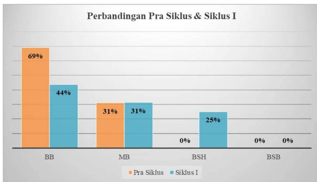
Gambar 2. diagram batang hasil perbandingan pra siklus dan siklus I

Hasil pembelajaran siklus I (dari pertemuan pertama hingga kelima) memperlihatkan bahwa dalam kemampuan mencocokkan anak, 7 anak berada pada tahap Belum Berkembang (BB), 5 anak pada tahap Mulai Berkembang (MB), 4 anak pada tahap Berkembang Sesuai Harapan (BSH), dan tidak ada anak yang mencapai tahap Berkembang Sangat Baik (BSB). Meskipun penggunaan puzzle shape memory game telah meningkatkan kemampuan mencocokkan anak, peningkatan ini belum memenuhi standar indikator penilaian. Konsekuensinya, diperlukan siklus II untuk mencapai indikator penilaian yang telah ditentukan.