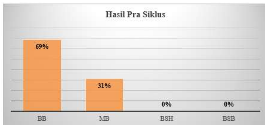
Gambar 1. diagram batang hasil pra siklus

Observasi awal yang dilakukan pada 14 Januari 2025 bersama pendidik Ibu Fadila Zaskia menjadi dasar prasiklus penelitian ini. Tujuannya adalah untuk mengevaluasi kemampuan mencocokkan anak sebelum dimulainya Penelitian Tindakan Kelas (PTK). Hasil pengamatan menunjukkan bahwa penggunaan puzzle sebagai media belum secara efektif meningkatkan kemampuan mencocokkan anak usia dini hingga mencapai kriteria “Berkembang Sesuai Harapan” (BSH). Temuan ini kemudian mengarahkan penelitian untuk merancang intervensi yang bertujuan untuk mengembangkan kemampuan tersebut. Kondisi ini diduga disebabkan oleh kurangnya paparan anak terhadap konsep bentuk geometri sebelum penelitian, serta praktik pembelajaran geometri yang selama ini tidak memanfaatkan media visual atau manipulatif untuk memfasilitasi pemahaman konsep. Berikut disajikan hasil dari pra siklus: