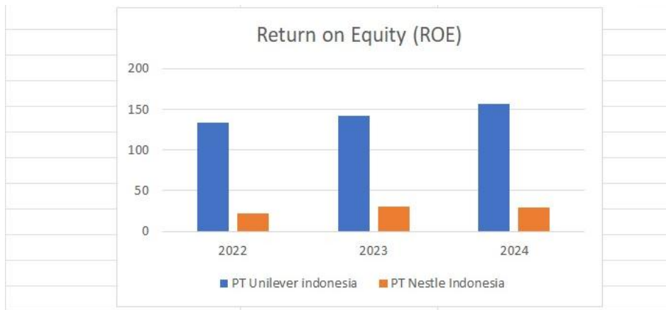
Gambar 4. Return on Equity

Karena penurunan ekuitas lebih besar dari penurunan laba, ROE terus meningkat walaupun laba bersih menurun. NPM dan ROA juga menurun, menunjukkan penurunan efisiensi dan profitabilitas. Untuk pembahasan Ekuitas yang merupakan Asset setelah hutang dilunasi adalah sebagai berikut, nilai ROE tergantung dari net income dibagi total ekuitas. Kalau meningkat 2x lipat, artinya liabilitasnya bernilai seperti modalnya. Di Unilever, asset yang dimiliki lebih besar dari Nestle Indonesia dapat dilihat juga dari angka ini. Asset tersebut berupa tanah, mesin, pabrik, dan perlengkapan seperti tools.