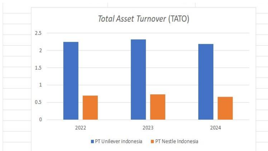
Gambar 1. Total Asset Turnover

TATO cukup stabil, tetapi di 2024 akan ada penurunan kecil.