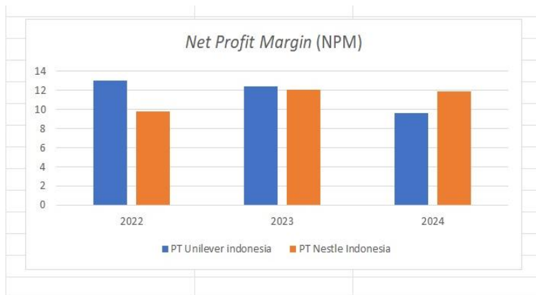
Gambar 2. Net Profit Margin

Berdasarkan NPM 2022–2024, Unilever Indonesia Tbk memulai dengan profitabilitas lebih tinggi (13.01%) dibandingkan Nestlé Indonesia Tbk (9.82%), tetapi mengalami penurunan ke 9.59% pada 2024, sementara Nestlé meningkat ke 11.91%. Rata-rata NPM Unilever (~11.68%) sedikit lebih tinggi dari Nestlé (~11.26%), namun Nestlé lebih adaptif terhadap tantangan pasar dengan fokus pada segmen nutrisi/minuman, sementara Unilever menghadapi tekanan biaya meskipun unggul dalam efisiensi persediaan dan utang usaha.